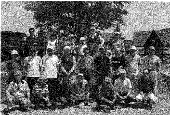
一日町 世代間交流グランドゴルフ大会 5月18日 第34回 世代交流グランドゴルフ大会を開催。大人と子供の交流を図った。参加者 子供 7名 大人19名