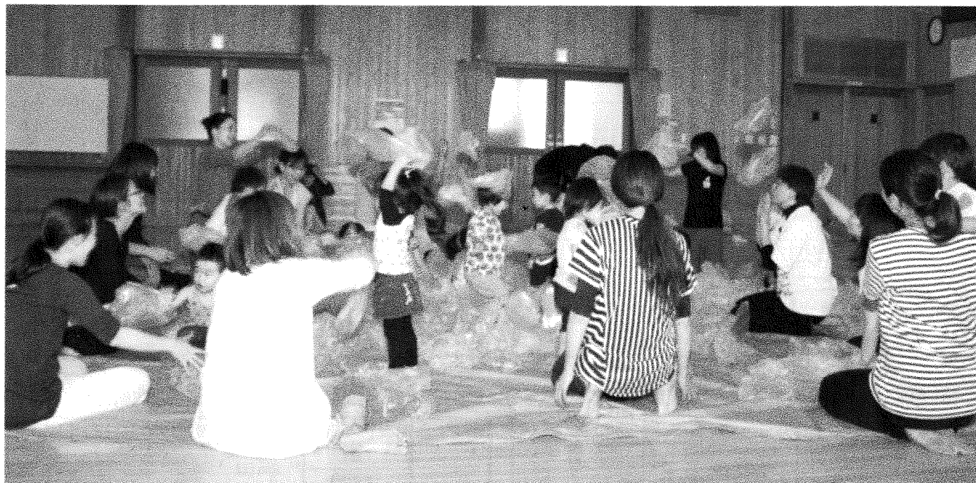
9月18日（金）天童南部公民館共催事業 第1回 子育て支援事業「親子体操教室」を開催。 親子でボール・ビニール袋などを使って体操を行い、楽しい時間を過ごした。参加者 16組32名

2015年10月15日号 発行 天童南部地域社会福祉協議会 TEL 656-9595