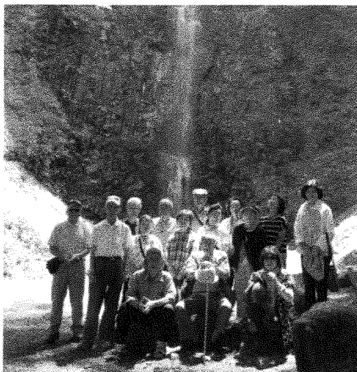
上北目 いきいきサロン。 7月13日 玉簾の滝と遊佐町十六羅漢岩・牛渡川湧水を見学した。 参加者 16名