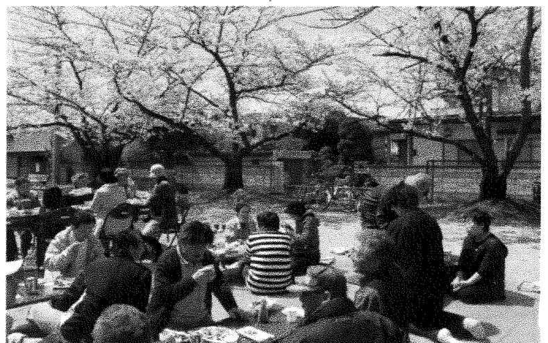
五日町 いきいきサロン「お花見会」 4月18日 絶好のお花見日和 満開の城山公園で楽しいお花見会を実施。 参加者 35名