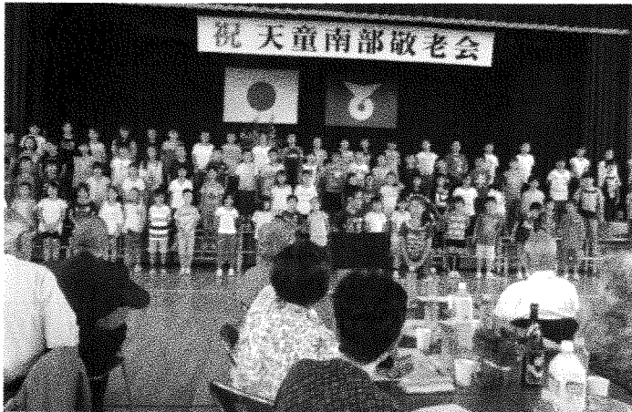
天童南部婦人会の主催で南部地域の敬老会が開催され、多くの方が参加し南部小4年生の歌や踊り等を楽しんだ。